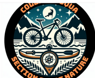
Rentrée au sommet pour la Section Sport Nature