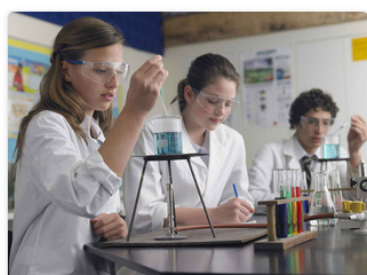
Découverte des métiers

Ci-dessous, quelques-unes des actions menées dernièrement :