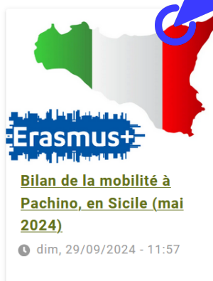
Bilan de la mobilité à Pachino, en Sicile (mai 2024)